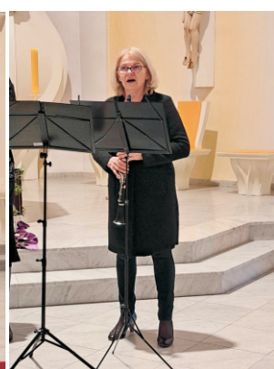
Postní rozjímání s hudebním uskupením FÚKNETO 10.3. 2024