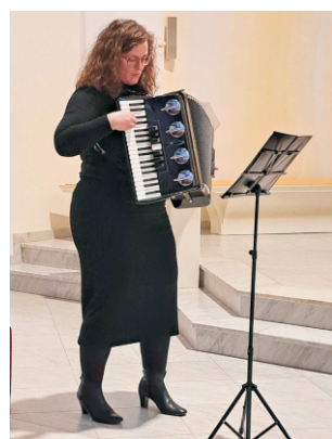
Křížová cesta do Nevšové 18.2.2024