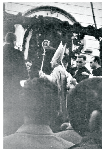
Svěcení zvonů 31.10. 1948