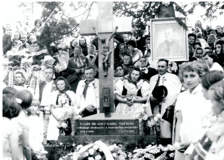
U hrobu v Pitíně 11.5. 1968, 80 let od narození Josefa Karla Matochy

Celých jedenáct let se komunisté snažili všechno tajit. Nebylo tomu jinak i kolem pohřbu. Komunistický režim zakázal obřad v olomoucké katedrále. Příbuzní se s ním rozloučili 6. listopadu 1961 v arcibiskupské kapli. Obřadu se účastnilo jen čtyřicet lidí. Je