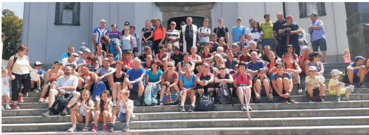
Pěší putování na Svatý Hostýn s brumovskými poutníky ve dnech 23.-25.7.2021