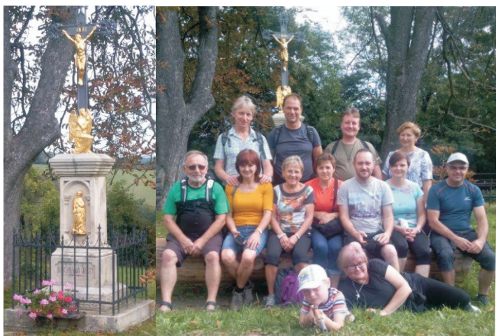
Pěší poutníci na Provodov v neděli 12.9.2021 (foto u kříže nad Řetechovem)