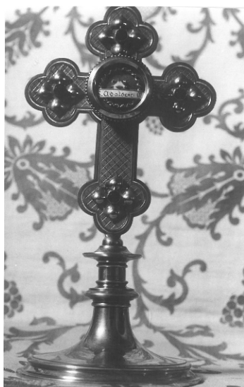
Ostatky sv. Vojtěcha darované arcibiskupem pražským Josefem Beranem Slavičinu k jubileu sv. Vojtěcha v r.1947