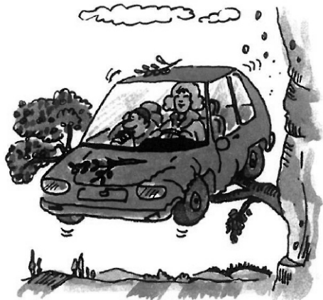
Nedrkotej zuby a podívej, jaký je tu krásný výhled.